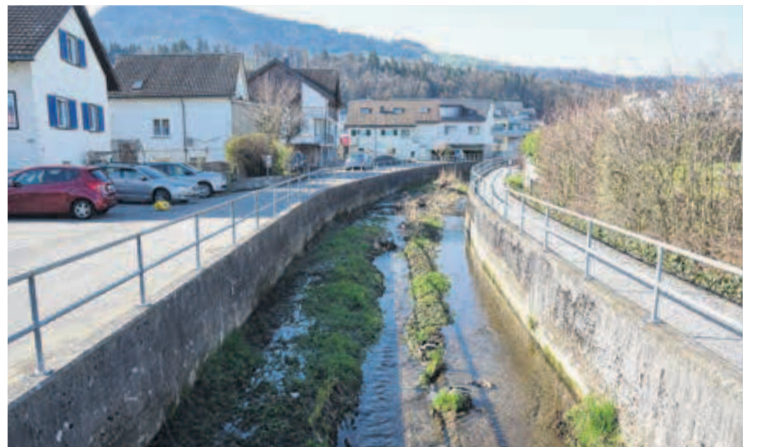
Auch der Canal Grande (Quartier Grütze) wird aufgewertet, vor allem die Bachsohle.