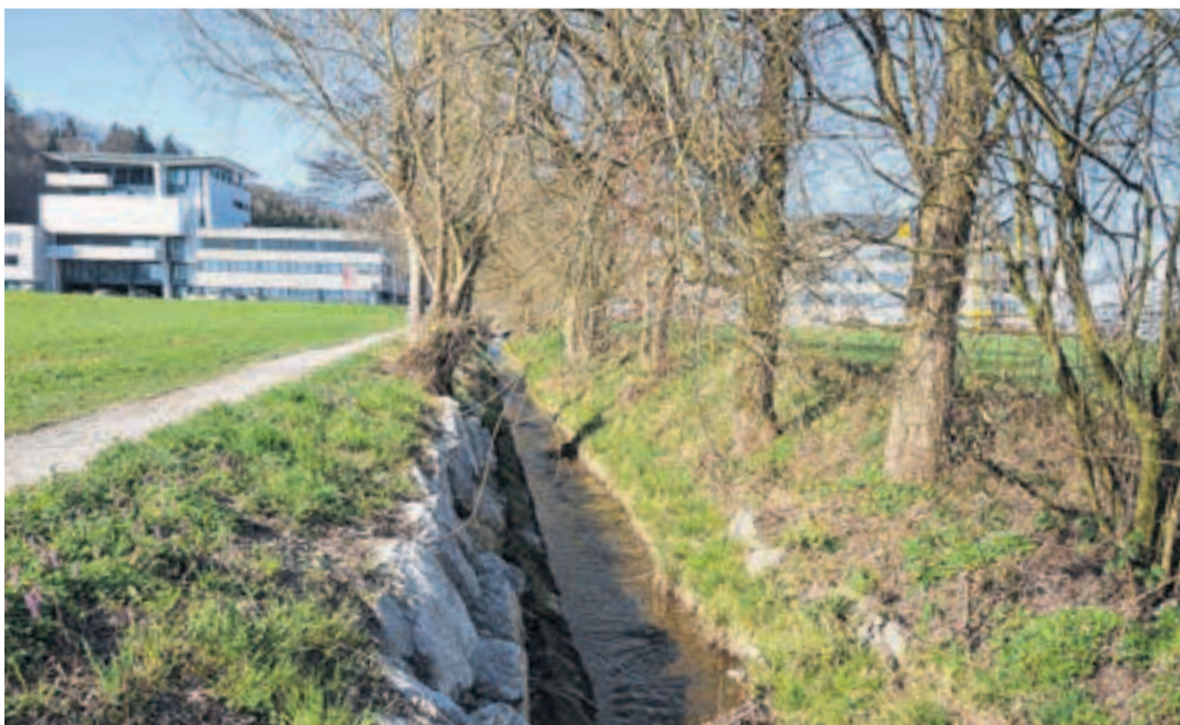
Entlang des Langachers erhält der Sarenbach neu insgesamt 17 Meter Breite.

Die Bezirksgemeinde findet am 21. April um 19.30 Uhr im Maihofsaal in Schindellegi statt. Die detaillierte Botschaft wird bald in alle Haushalte versandt.